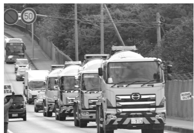
碎石を満載したトラック(上) 隊列を組んでやってきたミキサー車(下)

が道に出すぎているわよ。通行妨害よ」と。その警官は、苦笑いをして、一歩私のほつに近