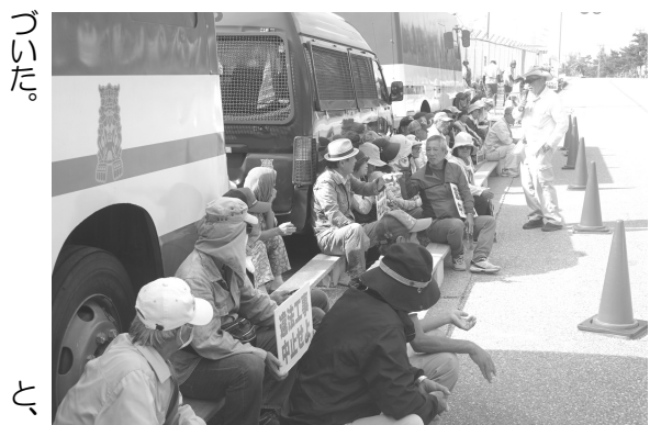
何もなかったかのように、また座り込んだ

トシロー、生コンミキサー車、かなりの数の工事車両が入れられた。聞くと、一週間ぶりだと言った。この日まで一週間、選挙があり、台風があり、さらに米軍ヘリ墜落事故があり、工事車両は一台も基地内に入れられなかった。待つてましたとばかりに入られたのがこの日だった。