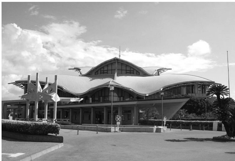
沖縄コンベンションセンターは、宜野湾市真志喜四丁目にある沖縄県立の会議展示センターです。隣接してビーチやマリナ、海浜公園、屋外劇場、体育館、野球場、リゾートホテルなどの施設があります。1987年に完成し、1998年には公共建築百選に選定されています。